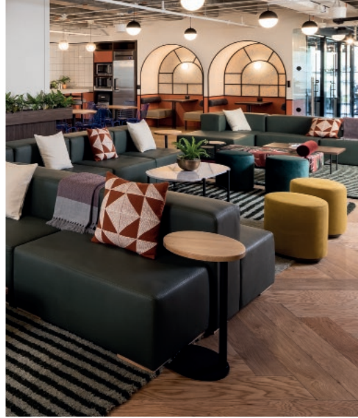
Sillón Uno / Mesa auxiliar Handy.