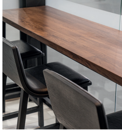
Silla de barra Bend / Mesa de barra Retiro.

Evita utilizar productos de limpieza que tengan químicos, pues la textura de la madera podrá variar y generar manchas.