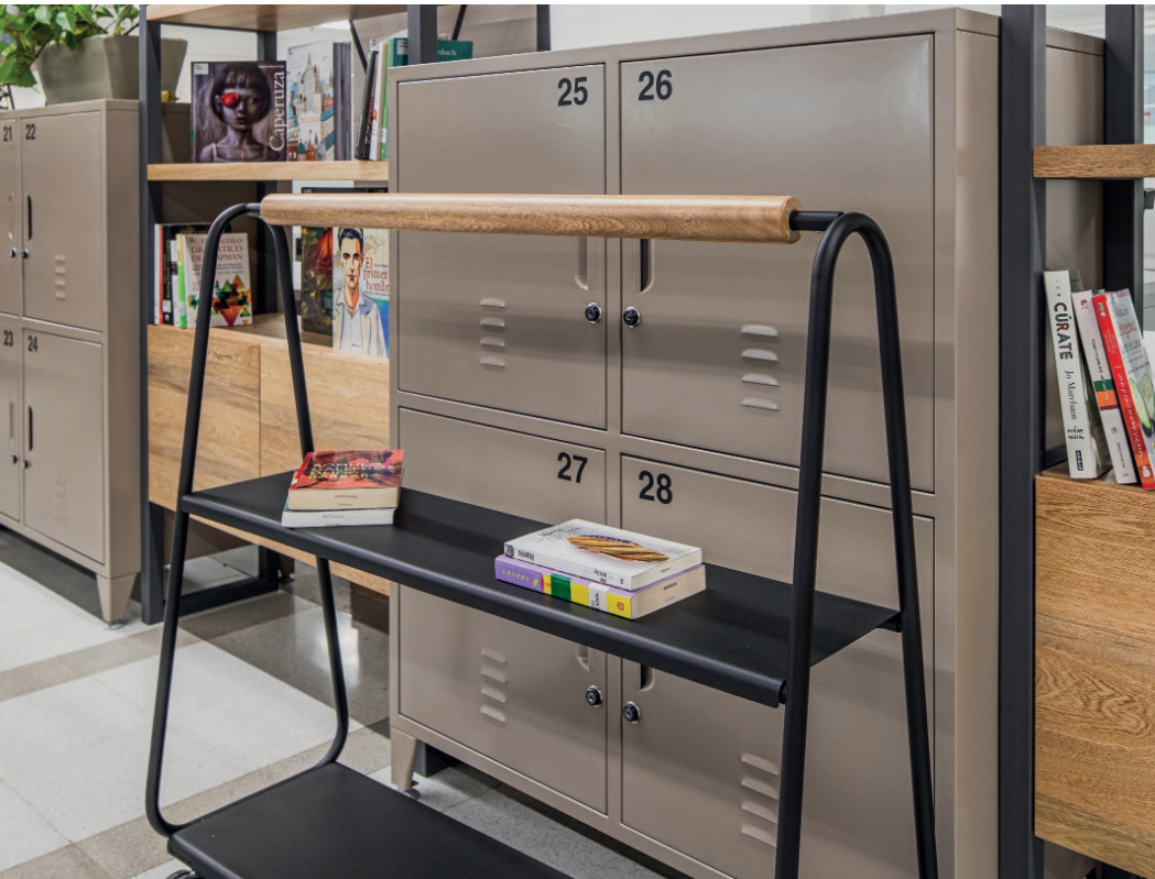
Locker / Biblioteca Tante / Kart Large.

Al cambiar el mueble de lugar es probable que sea necesario ajustar bisagras y rieles.