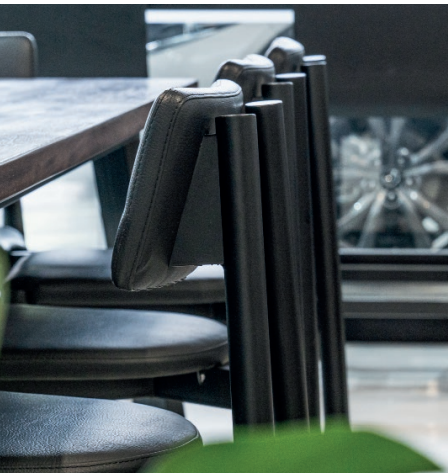
Silla multifuncional Irene.