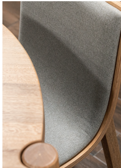
Mesa de comedor Irene / Silla Bend.