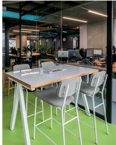
Escritorio AA / Silla de barra Lola.