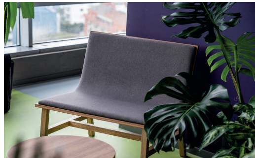
Mesa auxiliar Handy / Poltrona Bend.

Para limpiar manchas menores, utiliza un paño húmedo con Frotex® o jabones suaves especiales para telas y frota suavemente de manera circular.