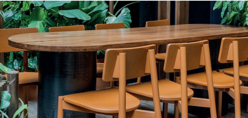
Silla multifuncional Irene.

Los requerimientos de calidad no cubren tratamientos inadecuados, falta de mantenimiento o prescindir de las recomendaciones de uso. En los puntos enumerados anteriormente, Perceptual Studio S.A.S. se compromete a reparar o sustituir el mueble o partes del mismo, sin costo, siempre y cuando se les hayan dado el uso adecuado y el mobiliario se encuentre en las condiciones adecuadas de higiene.