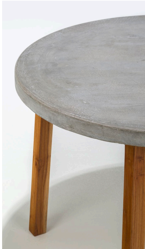
Mesa de comedor circular