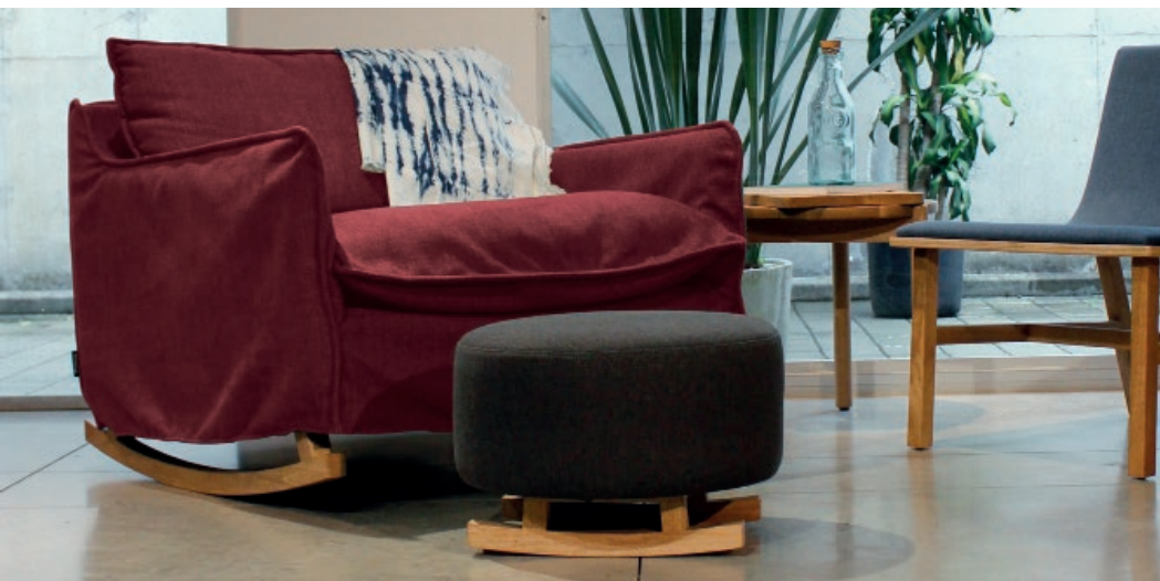
Mecedora RURU / Puff mecedora PEG.